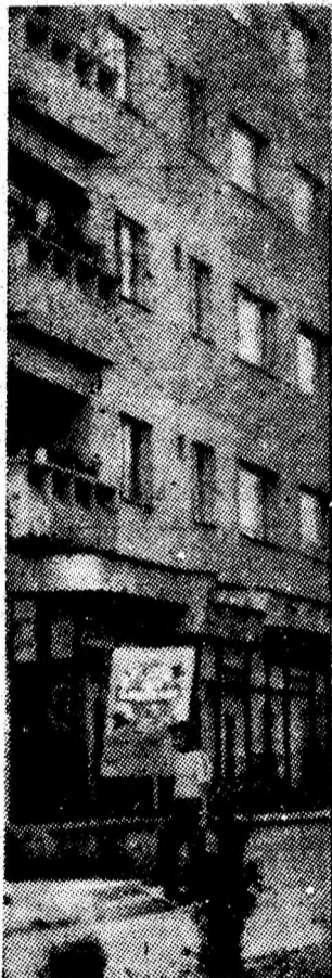
Cel mai tînăr oraș al municipiului, Uricani, tînde spre înălțimile urbanizării prin modernele sale blocuri de locuințe. Aspect din cartierul Bucura.

— Forța de muncă de care dispunem ne permite să asigurăm o plasare optimă la toate locurile de muncă din subteran, iar linia de front existentă este suficientă pentru a ne putea realiza de acum înaintea ritmic sarcinile de plan. Colectivul nostru este în măsură să se mobilizeze exemplar, așa cum a mai făcut-o de nenumărate ori, pentru a pași, definitiv, pe calea redresării și a se re-integra în rîndul colectivelor miniere fruntașe.