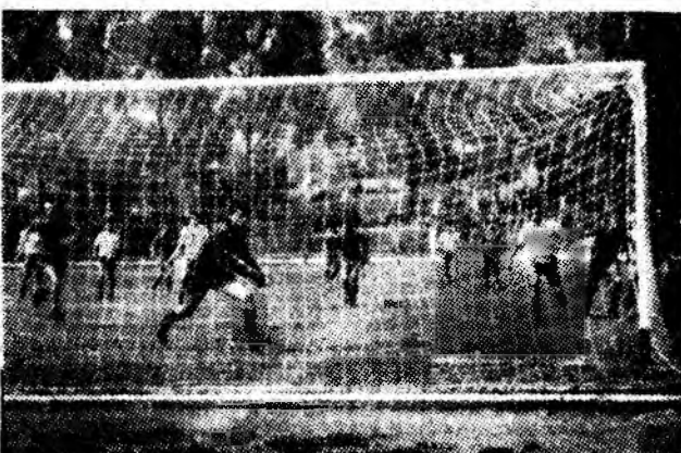
Acest gol splendid, marcat de Dina, în minutul 27 al partidei Minerul Lupeni — Sticla Arieșul Turda, avea să deschidă drumul spre victoria gazdelor.