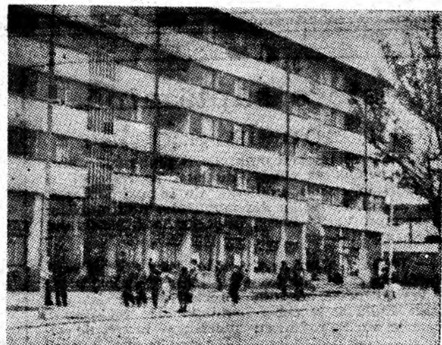
Aspect din cartierul Aeroport — Petroșani unde silueta zveltă a blocurilor de locuințe completează peisajul citadin.