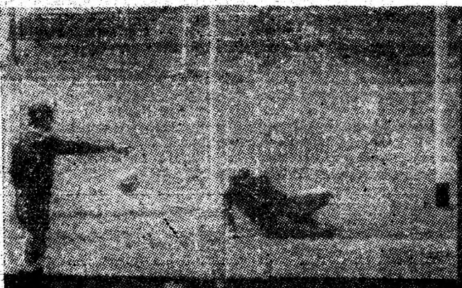
În imagine, portarul oaspeților este înfrînt pen- tru a 5-a oară de înaintașii formației Minerul Știința Vulcan.