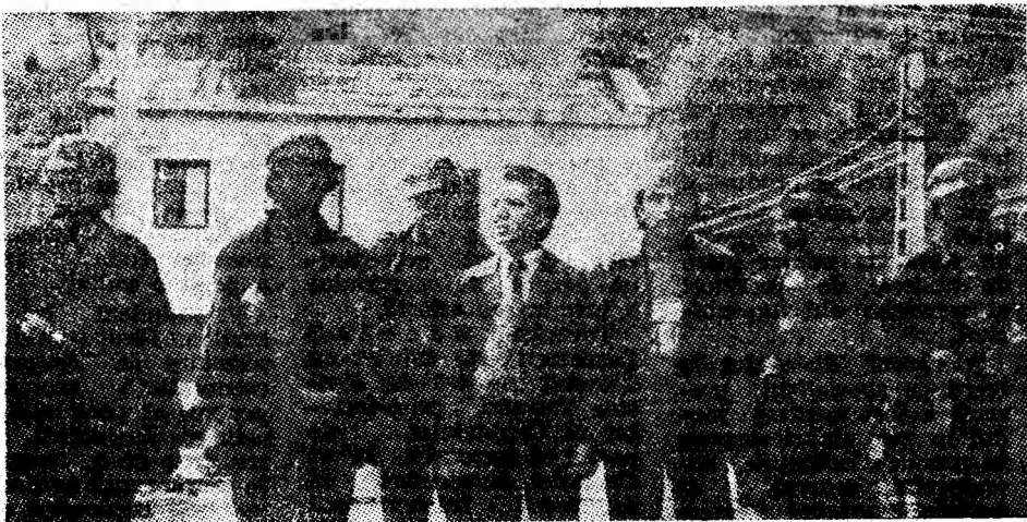
În imagine șeful de brigadă, împreună cu o parte din ortacii săi.