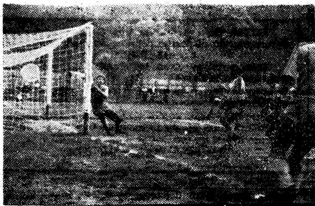
Fază din meci.

Meciurile tur vor avea loc la 24 octombrie, iar returul la 7 noiembrie.