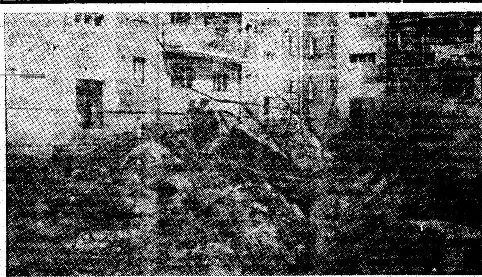
Pe strada C. Mille, lângă blocurile noi, locuite deja, din cartierul Petroșani Nord, această grămadă de fier vechi constituie un răspuns la întrebarea: „de ce A.C.M. Petroșani nu și-a realizat planul la fier vechi pe primele 9 luni ale anului?”. Aspectul din fața acestui bloc este dezolant, așa cum se vede din această imagine.