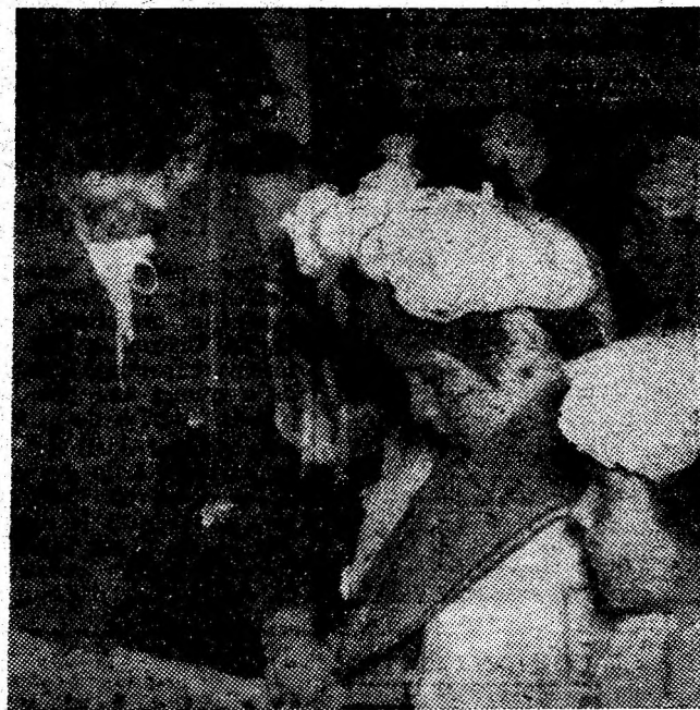
Primiriile în organizațiile de pionieri, eveniment emoționant în aceste zile pentru elevii claselor a II-a. În imaginea de mai sus, un instantaneu surprins la Muzeul mineritului, protagoniști fiind elevii claselor a II-a A și a IV-a de la Școala generală nr. 1 din Vulcan.

Minierii de la Petrița au dat dovadă în nenumărate rânduri de puterea de a depăși momentele grele care s-au ivit în activitatea lor. De aceea sintem convinși că și de această dată, colectivul minei va ști să se mobilizeze pentru a depăși aceste greutăți cu care s-a confruntat și că va încheia luna octombrie cu rezultate pe măsura prestigiului câștigat prin muncă de-a lungul celor nouă luni.