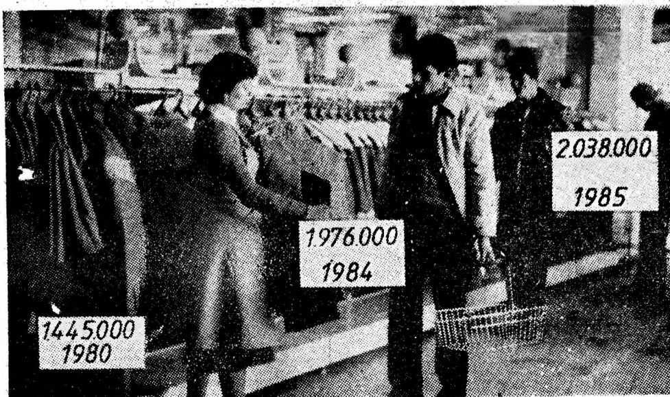
Creșterea volumului desfacerii de mărfuri (mii lei).

Pagină realizată de Tiberiu SPĂTARU Ilustrația: Ioan CUZMAN și Emil GHEȚA