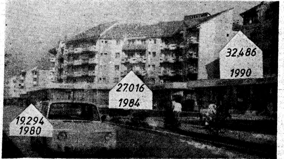
Numărul apartamentelor construite din anul 1965 și perspectiva zestre edilitare a Văii Jiului.

■ În acest cincinal se vor mai realiza: magazine generale la Aninoasa și Uricani, hală agroalimentară la Lupeni, laborator de alimentație publică la Petroșani, complex de alimentație publică la Vulcan.