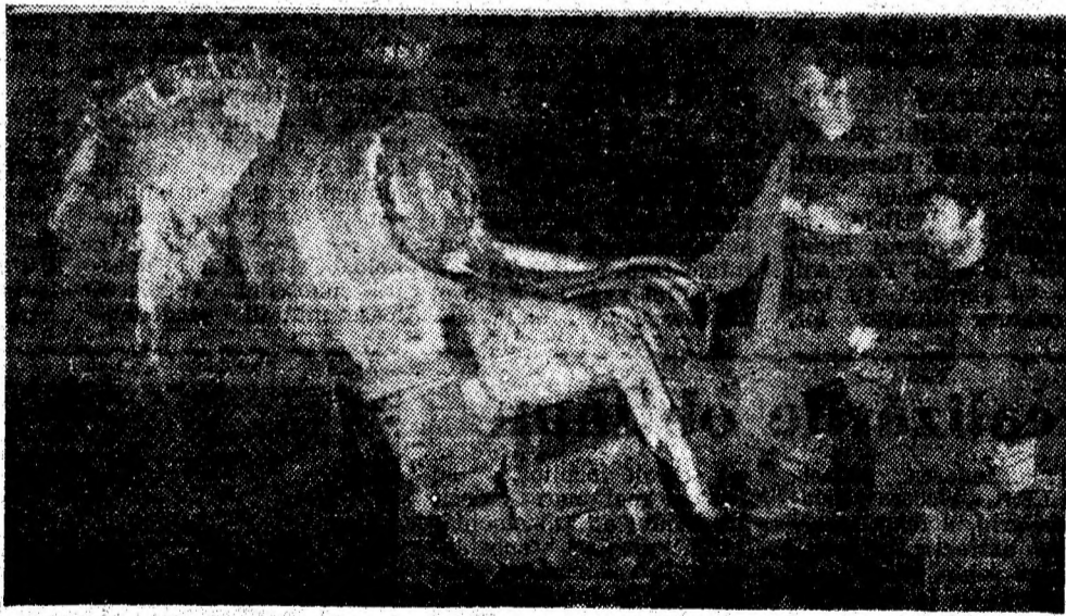
Brigada condusă de minerul Constantin Ciobănoiu (din cadrul sectorului IV — I.M. Paroșeni), lucrează într-un abataj mecanizat. Numai în această lună, brigada a extras peste sarcinile de plan 700 tone de cărbune pe seama realizării unei productivități medii de peste 16 tone/post.