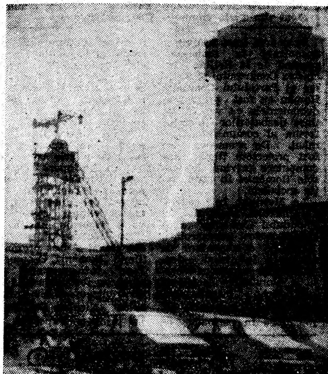
Puțul cu schip de la I.M. Lonea.