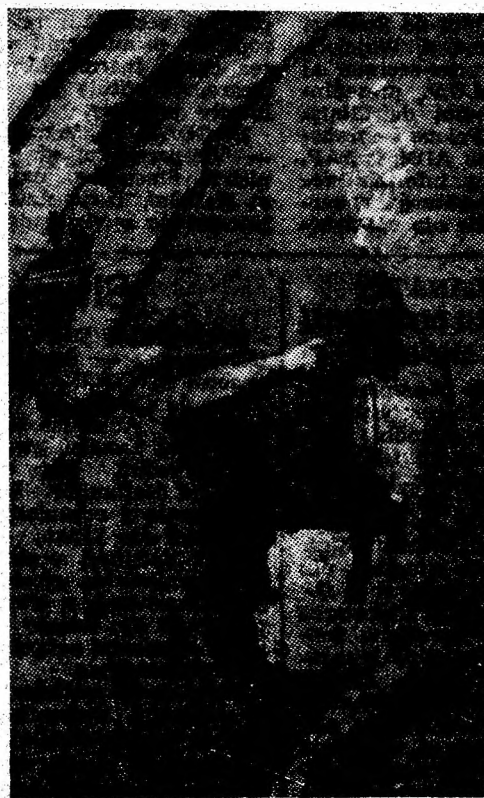
Utilaje moderne în subteranul Văii Jiului