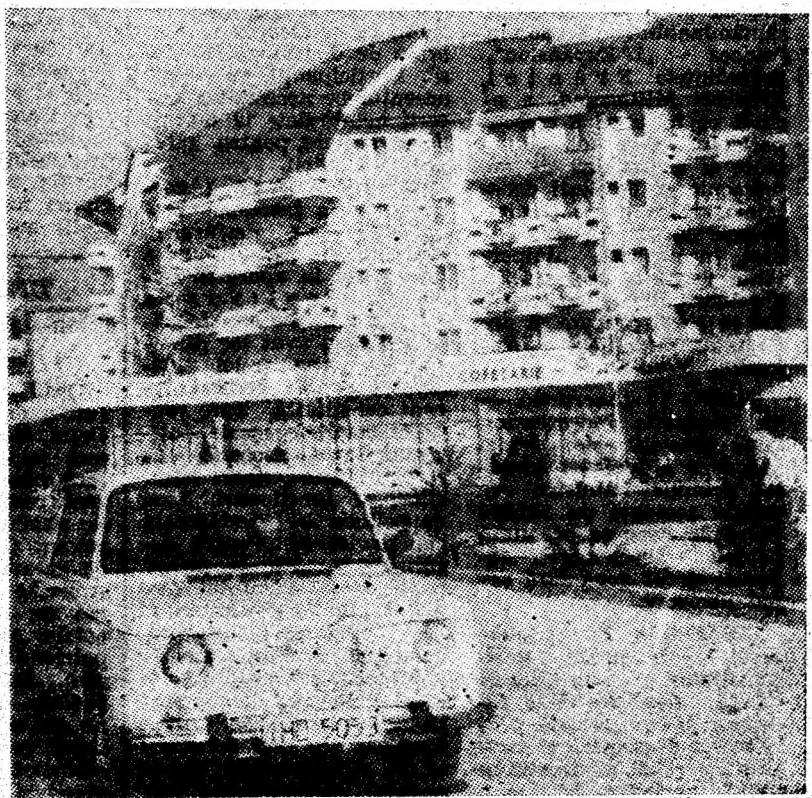
Noutăți edilitare în Petroșani.