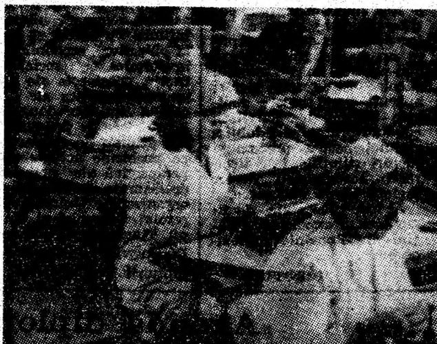
Intreprinderea de tricotaje Petroșani.

Citeva imagini care demonstrează elocvent saltul impresionant făcut de industria Văii Jiului.