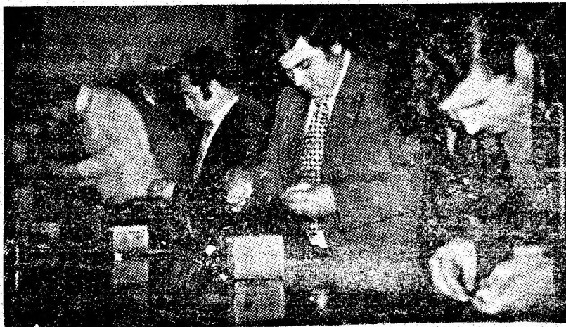
Susțin proba practică electricienii de mină.