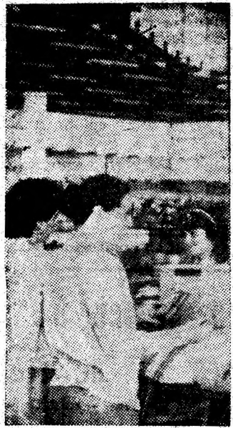
Secvență obișnuită, dialog între cumpărători și personalul din cadrul raioanelor modernului magazin „Jiul” din Petroșani.

s-au livrat cantități sub cerințele formulate de maiștri prin comenzi. Aceeași situație se menține în prezent. De la S.U.T. Livezeni se prezintă zilnic aceleași explicații: uneori lipsesc sorturile de agregate de balastieră, alteori nu sînt mijloace de transport suficiente. Spațiile pentru descărcare din gara Livezeni sînt înguste în comparație cu necesitățile zilnice ale punctelor de lucru. Această situație este cunoscută și dănuie de mai multă vreme fără să fie rezolvată, iar venirea iernii o va agrava și mai mult. Or, constructorii au nevoie de betoane și nicidecum de explicații, pe șantiere. Rezolvarea acestei probleme se impune cu necesitate pentru a asigura un ritm mai bun de lucru, recuperarea rămîinerilor în urmă față de grafice în zona Petroșani Nord și pe alte șantiere.