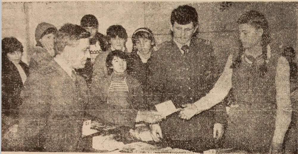
Cu puțin timp în urmă, în sala căminului I.M. Vulcan, a avut loc o ședință festivă de înmînare a buletinelor de identitate unui număr de aproape 200 elevi de la școlile din orașul Vulcan, care au împlinit vârsta de 14 ani. În imagine, un aspect din timpul festivității.

Lt. colonel Nicolae PATRUȚ, Miliția municipiului Petroșani