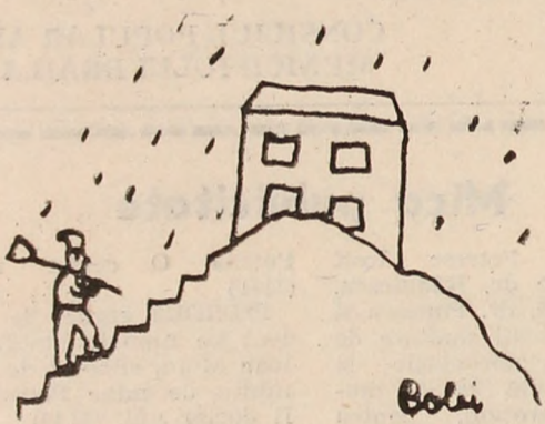
Desen de Norbert Coandras.