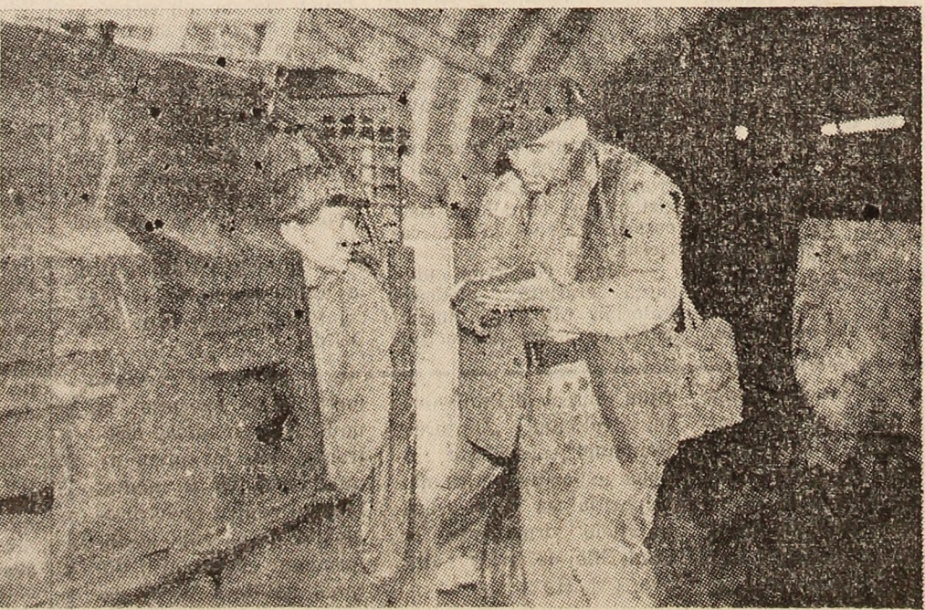
DE LA O DUMINICA LA ALTA

Factorii principali ai unității poporului român — la rubrica „Sistem dintotdeauna pe aceste locuri” ■ Paloma Blanca — literatură de anticipație ■ Dicționarul iernii — cronică rimată ■ Anecdotele științei