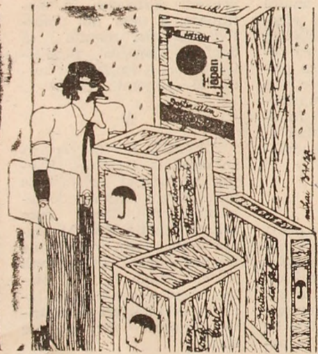
Un transport special... de sezon.

La 46 de ani, Louis Pasteur — chimist și biolog francez (1822—1895) — a suferit o hemoragie cerebrală în emisfera dreaptă. Viața lui a fost în mare pericol. Totuși, s-a refăcut în scurt timp și s-a putut ocupa mai departe de cercetările sale științifice. A murit la 73 de ani și la autopsie s-a constatat că emisfera cerebrală dreaptă era aproape atrofiată. Același lucru se producea și la leziune gravă a creierului nu a fost însă o piedică de netrecut în calea activității creatoare a lui Pasteur... După boală a făcut cele mai mari descoperiri, care au revoluționat medicina.