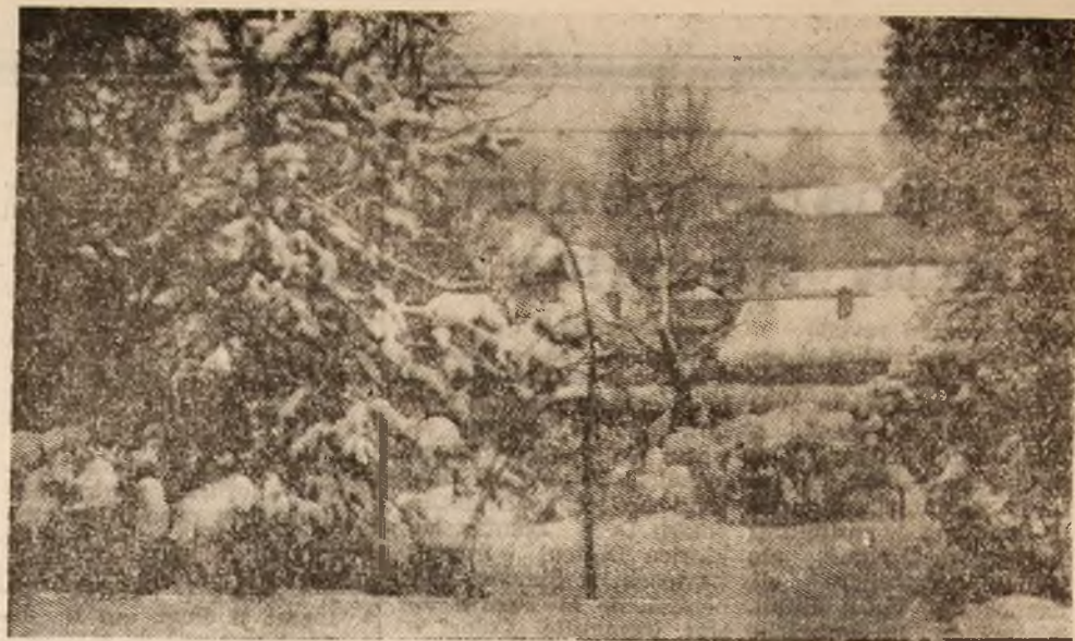
Frumusețea decorului hibernal, unul dintre darurile pe care natura ni le face în fiecare an.