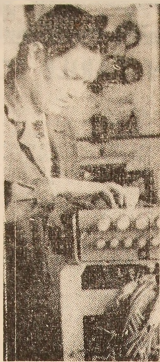
În cadrul atelierului electromeccanic al I.M. Vulcan utilajele și instalațiile miniere beneficiază de o minuțioasă verificare înainte de a fi introduse în subteran.

În toate celelalte domenii de activitate, adunările în organizațiile de sindicat trebuie să contribuie la înfrumusețarea activității productive, de cercetare, proiectare, a prestațiilor de servicii și celorlalte activități. Pornind de la mobilizatoarele angajamente asumate în chemările la întrecere lansate la acest început de an, grupele sindicale, organizațiile de sindicat au îndatorirea de a impune tuturor colectivelor un ritm de muncă înscris pe coordonatele înaltei dăruiri patriotice, pentru a răspunde exigențelor actualei etape de dezvoltare multilaterală a societății, sarcinilor desprinse din documentele Congresului al XIII-lea al partidului.