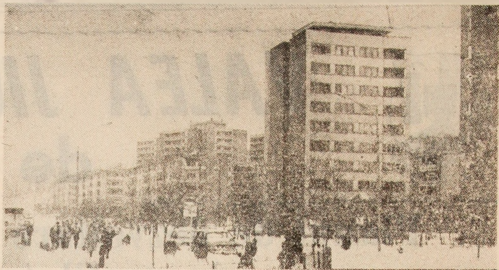
Chiar dacă iarna s-a mai „cumințit”, peisajul din jurul nostru ne avertizează că pînă la vremea... ghiocilor va mai trece timp.