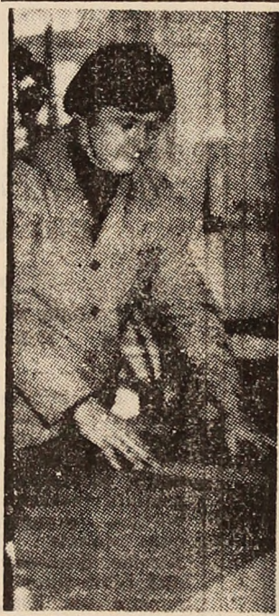
LUCRARI DE DEZVOLTARE A REȚELEI DE CĂI FERATE DIN MUNICIPIU

puncerile vizînd dezvoltarea capacităților miniere și de preparație, extinderea platformei industriale Livezeni, mobilarea centrului civic, modernizarea transportului în comun, lucrările tehnico-ediliter, amenajarea zonelor de petrecere a timpului liber și a unor intersecții stradale. (I.V.)