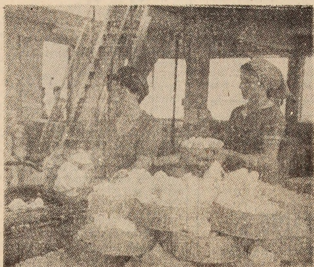
Activitate intensă în secția de preparare a cuarțului din Uricani.