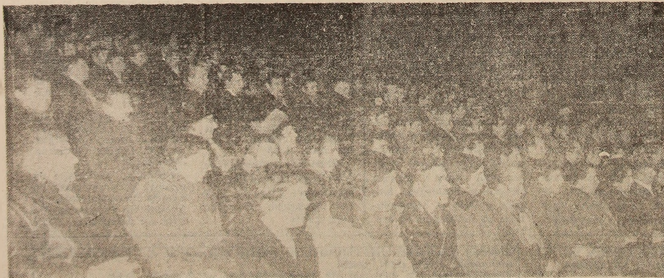
Aspect din timpul desfășurării lucrărilor consfătuirii.