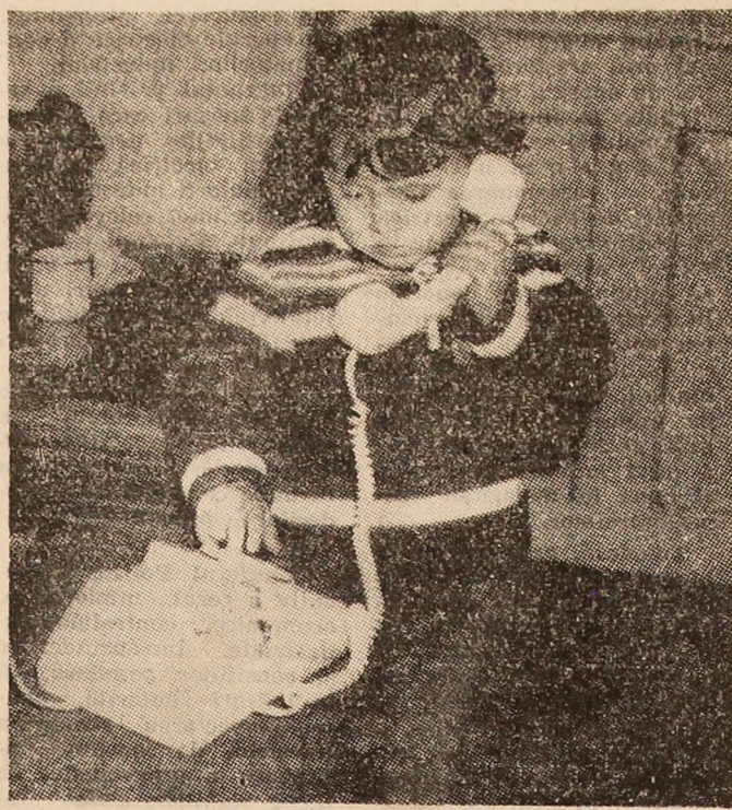
„Alo, mămica... ?”