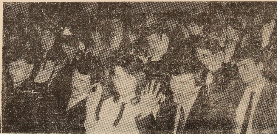
Votul delegaților la conferință — expresie a încrederii depline în forța revoluționară a tinerei generații.