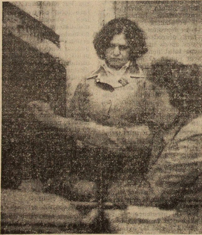
Centrala telefonică a oficiului P.T.T. Uricani.

Apreciatul artist cunoscut în lume, Francisc Nemeth, care a mîrturisit că aceeași fotografie este prezentă și la Tokio într-o expoziție care va fi itinerată în marile orașe ale Japoniei. O altă lucrare, „Munle”, este cuprinsă într-o altă expoziție din Hong Kong. Ochiul inspirat al lui Francisc Nemeth de operă noi și noi frumuseți și apreciate în marile expoziții din lume. (T. Ștaru)