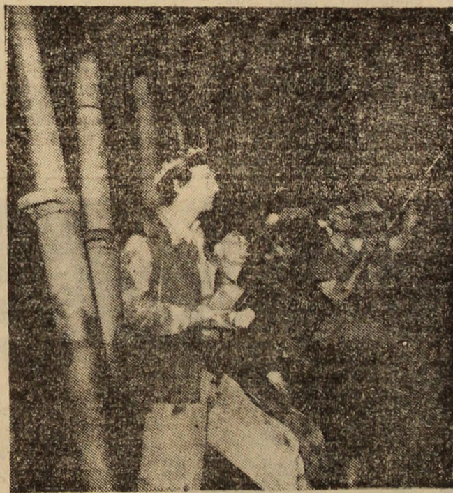
Unul din abatajele frontale al sectorului IV. Se controlează frontul înaintea începerii lucrului.

Prin întreaga lor activitate, minierii sectorului IV constituie un exemplu mobilizator pentru întregul colectiv al minei.