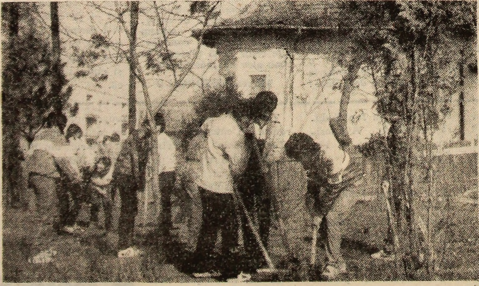
Elevii Liceului de matematică-fizică din Petrosani s-au aflat în aceste zile în primele rînduri în acțiunile de gospodărire și infrumusețare a reședinței de municipiu.