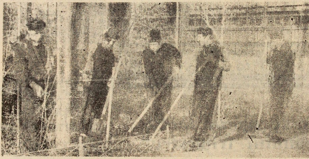
Ample acțiuni gospodărești și de înfrumusețare.

Oamenii muncii, gospodarii de la I.P.S.R.U.E.E.M. se întrec pe sine, în aceste zile, pe șantierul primăverii, promovînd pe un front larg frumosul edilitar.