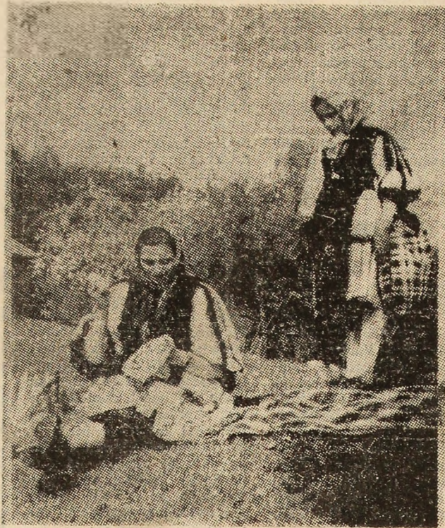
Pregătiri de nedeie.