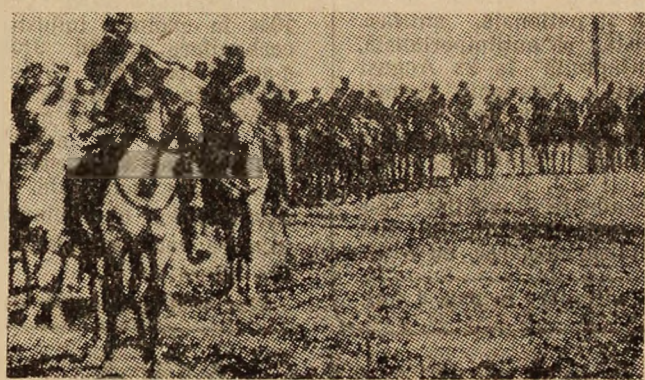
1877 — coloană de cavalerie îndreptîndu-se spre teatrele de luptă.

Astăzi, la 40 de ani de la victoria asupra fascismului, gîndul nostru de pioasă recunoștință pentru vitejii ostași ai armatei române se împletește cu lupta pentru triumful politicii partidului nostru, pentru progresul și independența națională, pentru destindere, securitate și dezarmare, pentru o lume a păcii și colaborării pe planeta noastră.