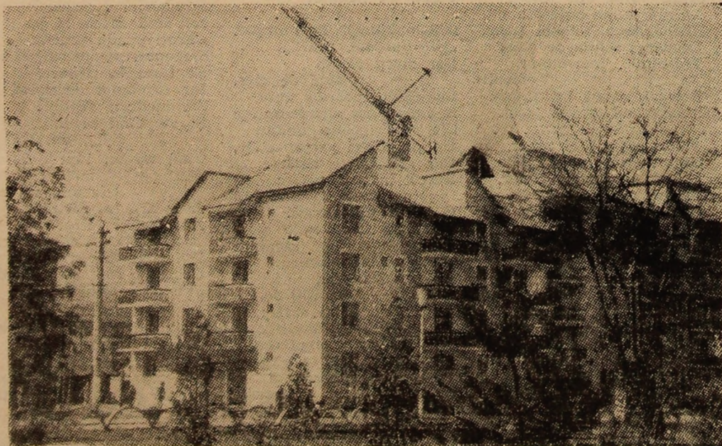
Orasul Vulcan — sub amprenta neconținutelor innoiri și împliniri ale urbanisticii moderne din acești ani.