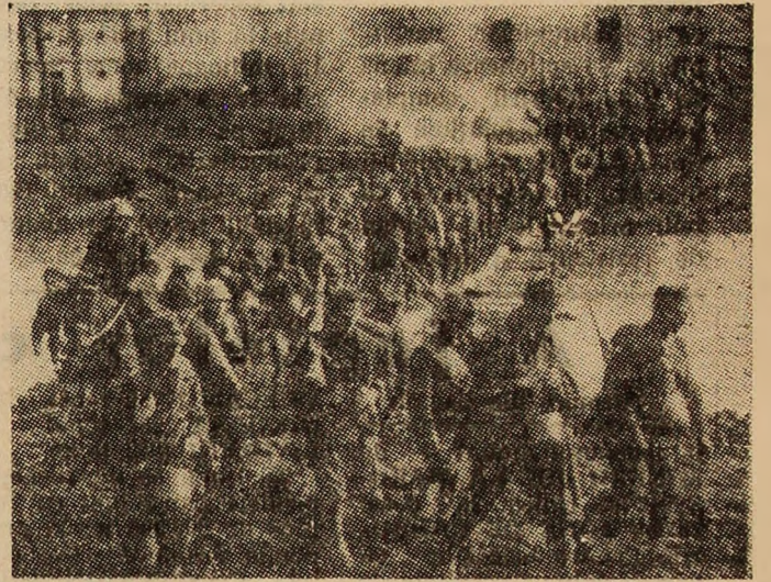
Octombrie 1944. Subunități ale armatei române înaintînd spre Carei.

Eroii patriei iubite, Cu voi, sub tricolor, în gînd, Purtăm ștabela, înainte, Pe drum de foc spre țel urcînd. De Plevna ne-amintim, de Tatra, În Mai, cînd munca e slăvită Și vad de flori ne este vrața De dragoste nețărîturită. Smulgînd Victoria visată Prin grele jertfe-n primăvară, Deschis-am vieții o fereastră De libertate pentru țară. De-atunci eroii ni se-arată În rînd cu Ziditorul țării Cîntat de România toată — De rîu, de ram, de-albastrul zării. Irimie STRĂUȚ