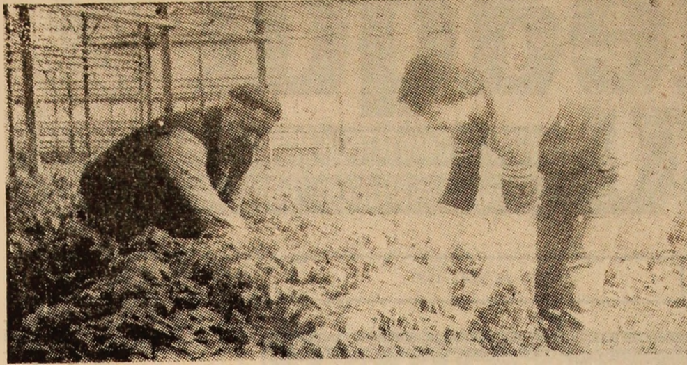
La sercele din Lupeni ale I.A.C.C.V.J., se culeg noi recolte, semn al unei primăveri rodnice.