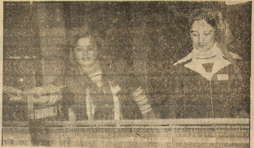
Unitate economică tînără în peisajul industrial al orașului Lupeni, țesătoria de mătase face pași importanți pe calea afirmării prin produsele de calitate realizate aici.