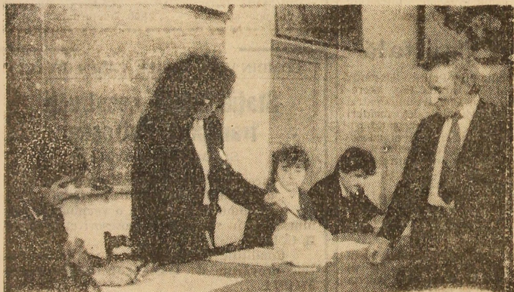
Emoții în amfiteatrele Institutului de mine din Petroșani. A început sesiunea de examene...

Comitetul Politic Executiv al Comitetului Central al Partidului Comunist Român