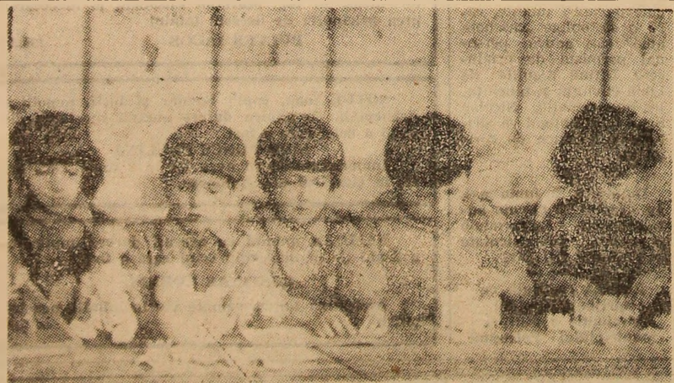
În grădinițele din Valea Jiului, modern utilizate, copiii au la dispoziție săli de joacă și activități practice.