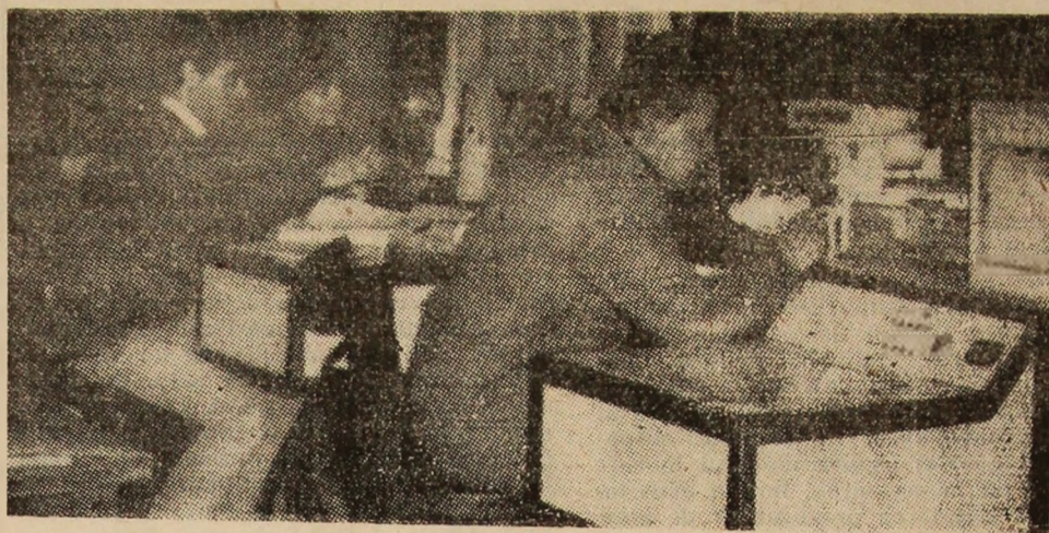
La U.E. Paroșeni, un colectiv care și-a sărbătorit în această primăvară 30 de ani de existență prin rezultate pe măsura priceperii și măiestriei meseriașilor săi este cel de la laboratorul de automatizări măsură și control, colectiv de muncă ce se definește prin precizia și siguranța cu care execută lucrările ce îi sint încredințate.

În mod nemijlocit, dezvoltarea extracției cărbunelui din Valea Jiului se va răsfrînge asupra gradului urbanistic al așezărilor noastre, asupra bunăstării materiale și spirituale a minerilor. Se deschid astfel noi perspective de progres și înflorire a municipiului, în pas cu dezvoltarea multilaterală a patriei, așa cum prevăd istoricele documente adoptate de Congresul al XIII-lea al partidului. Sub conducerea înțeleaptă a secretarului general al partidului, epoca de aur a României socialiste moderne înscrisă în cronică patriei sub numele strălucitului ei ctitor, ca „Epoca Nicolae Ceaușescu”, va dobîndi noi dimensiuni, va însuma noi realizări de prestigiu, asigurând înaintarea fermă a țării noastre spre edificarea celei mai drepte și mai umane orînduri din cîte a cunoscut istoria omenirii — orînduirea comunistă.