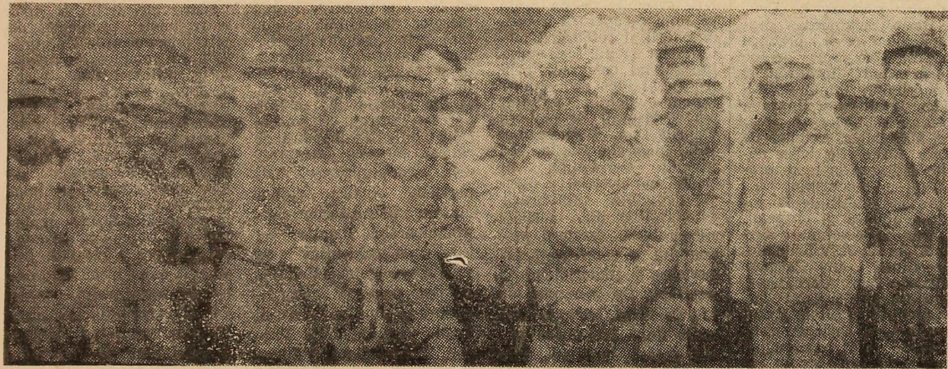
Colectivul de muncă al sectorului V (investiții) al minei Dilja se află în permanență pe unul din locurile fruntașe ale întreprinderii. În imagine, o parte dintre componenții brigăzilor fruntașe.