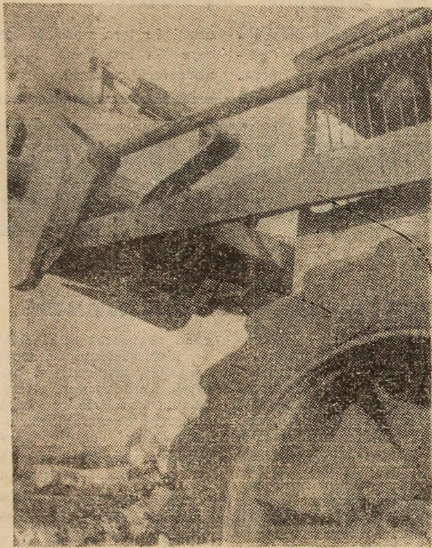
Mecanizarea muncii în unitățile forestiere, un semn al noului în Valea Jiului. Aspect de la unul din punctele de lucru ale U.F.E.T. Petroșani, respectiv, depozitul de prelucrare a lemnului Isroni.