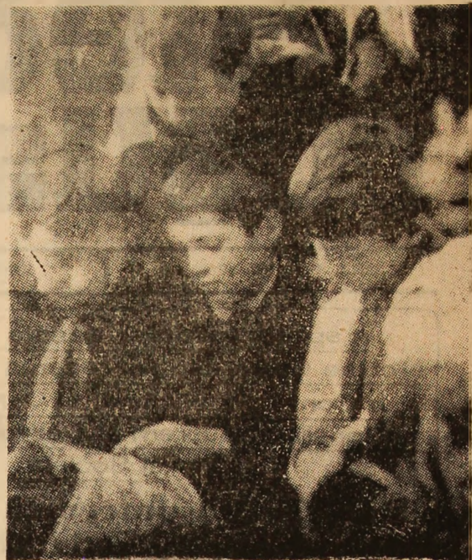
In recreație...

Acestor nobile sentimente și gânduri a slujit cauza păcii, de a contribui cu faptele de muncă la înfăptuirea politicii interne și externe a partidului și statului nostru, le-au fost dat expresie cu puternică vibrație și în textul telegramii adresate de adunarea colectivului de la I.P.S.R.U.E.E.M., secretarului general al partidului, tovarășului Nicolae Ceaușescu, cel mai iubit fiu al României socialiste. (I.B.)