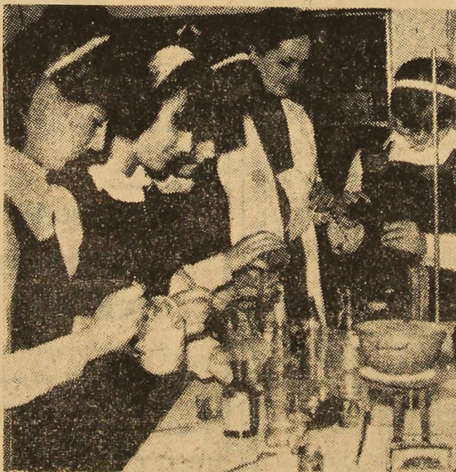
Elevii clasei a X-a A de la Liceul economic și de drept administrativ din Petroșani, la o oră de curs în laboratorul de chimie.

Adunări festive consacrate sărbătoririi „Zilei învățătorului” au avut loc și la Lupeni, Vulcan și Petrița. Participanții au adoptat telegrame adresate tovarășului Nicolae Ceaușescu, secretarul general al partidului, președintele Republicii Socialiste România, exprimîndu-și deplina adevărul și stăruindu-se să-și consacre toată energia pentru pregătirea temeinică a tinerei generații. În încheierea adunărilor s-au desfășurat spectacole susținute de formații ale elevilor, distinse în Festivalul Național „Cîntarea României”.