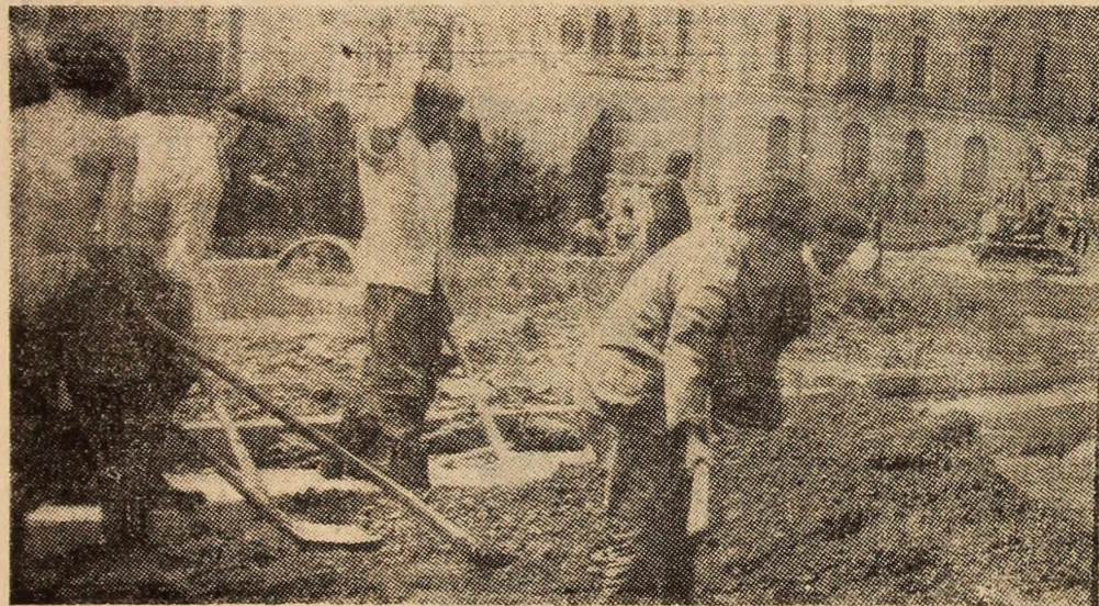
Petroșani. Se lucrează la finalizarea bulevardului Republicii în zona noului pod peste Maleia.