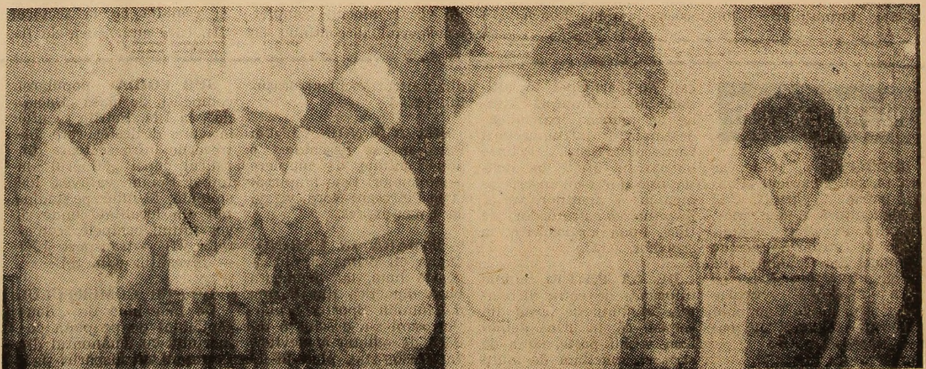
Fabrica de produse lactate, situată pe platforma industrială Livezeni, se integrează prin rezultatele deosebite în peisajul economic al reședinței de municipiu. În imagine, două secvențe, prima din secția de îmbuteliere a produselor lactate, a doua din laboratorul de analize.

De consemnat încă un aspect: fiecare dintre noile articole este omologat împreună cu cîte un alt produs, confecționat din materialele recuperabile, rămase de la croială sau de la resturile de partizi — asigurîndu-se, în felul acesta, o valorificare superioară a materiei prime. (C.T.D.)