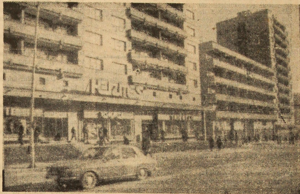
Verticalitatea — o dimensiune a tinereții orașului.