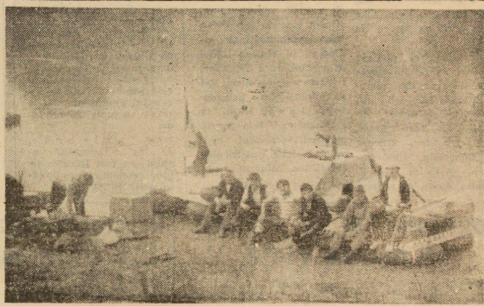
Popas pe mîlul Mureșului.

Dincolo de rezultatul tehnic al întîlnirii, meciul a fost, în primul rînd, un prilej de deconectare pentru spectatori, colegi de muncă ai celor din teren. Este și firesc, pentru că, iată, au putut vedea nu mai puțin de 15 goluri. Ceea ce, trebuie să recunoaștem, pentru 90 de minute de fotbal nu e deloc puțin. Vasile BELDIE, Lonea