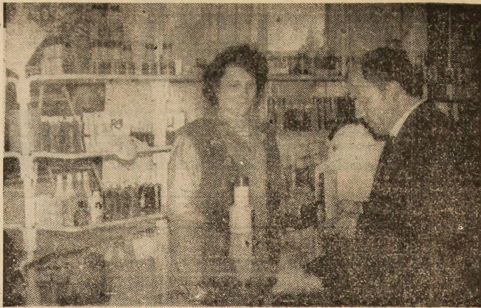
Magazinul general din Petrița — un etalon al comerțului din Valea Jiului. În imagine — raionul „Cosmetice”.