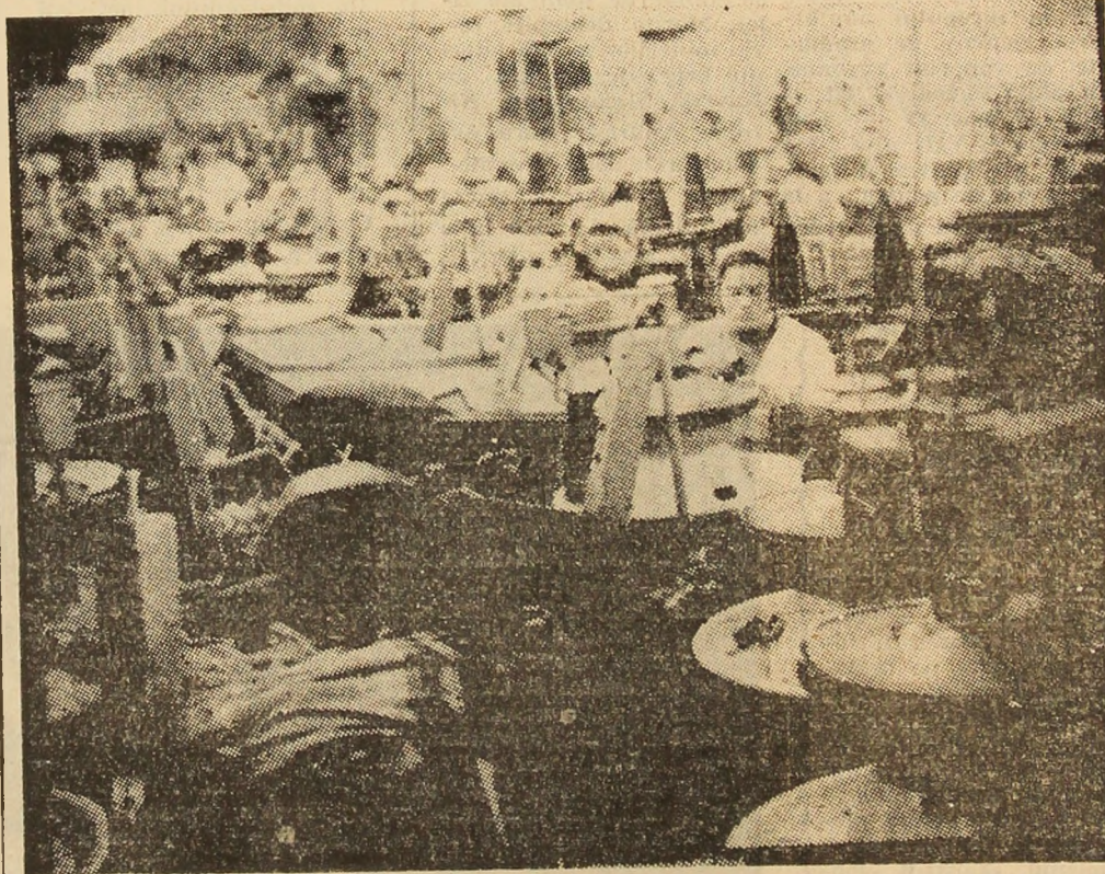
Aspect de muncă de la Întreprinderea de tricotaie Petroșani.