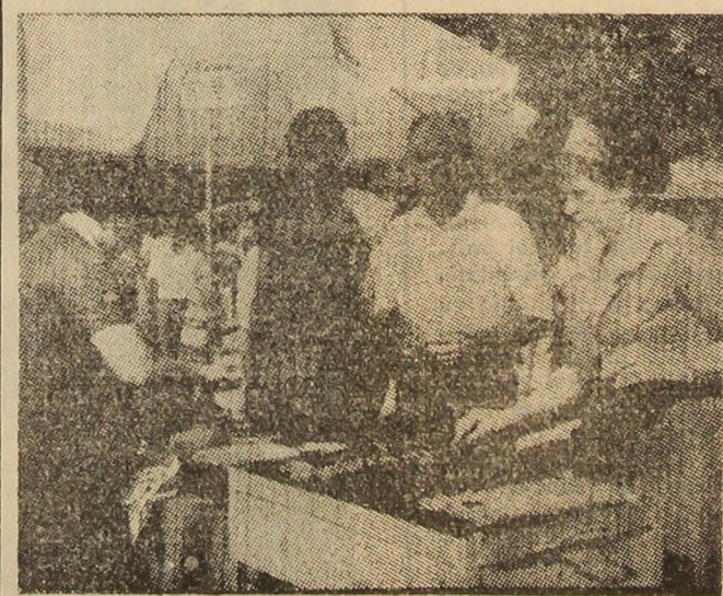
Zeci de tonete cu mici, grătare, bere și răcoritoare au stat la dispoziția celor ieșiți la iarbă verde în zonele de agrement.

Același lucru se poate spune și despre programul artistic. Evoluția fanfarei minerilor, a orchestrei și soliștilor de muzică populară, formațiilor „Armonic Grup” și „Color” a plăcut în mod deosebit locuitorilor Vulcanului care, în după amiaza zilei de 23 August, au poposit pentru cîteva ore la frumosul loc de agrement. (Gh.O.)