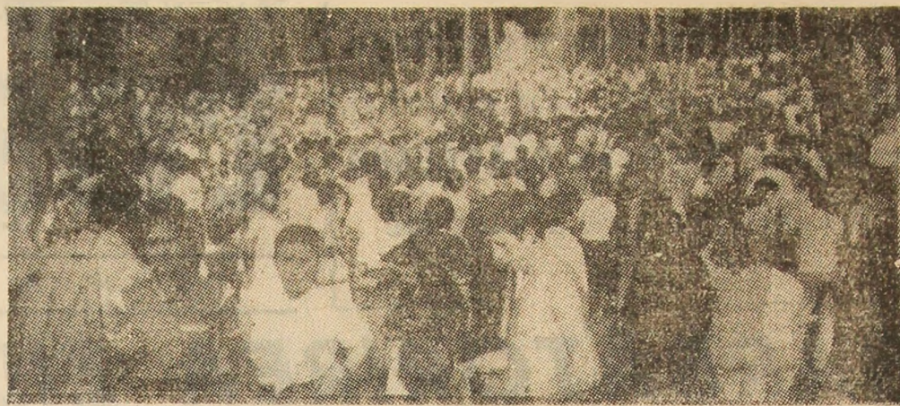
Mare afliuență de oameni, tineri și vîrstnici, în zona de agrement a Petroșaniului — „Brădet”.