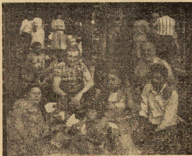
La iarbă verde...

plinirile din activitate cu care se confruntau unitățile de construcții-montaj au fost analizate în cadrul biroului executiv al consiliului popular orașenesc stabilindu-se măsuri ferme de remediere. Pe agenda de lucru a biroului executiv, a membrilor săi, a deputaților și a factorilor cu răspundere în activitatea de investiții, stă prioritar, în această perioadă de vîrf a activității de construcții, îndrumarea și controlarea sistematică, sprijinirea directă a activității din șantier acționîndu-se pentru perfecționarea organizării muncii, întărirea disciplinei și răspunderii cadrelor din unitățile de construcții-montaj. Mai presus de orice se urmărește, încadrarea lucrărilor în ritmul prevăzut în grafice, respectarea întocmai a tehnologiilor de execuție, a parametrilor de calitate, a consumurilor de materiale și comiterii oricărei risipe, astfel încît să se asigure finalizarea și intrarea la termen în funcțiune a noilor obiective ale dezvoltării economico-sociale a orașului.