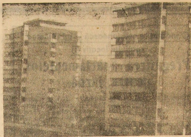
Vulcan — verticale moderne.