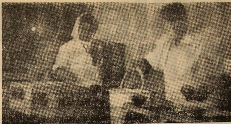
Instantaneu la Fabrica de răcoritoare Livezeni.