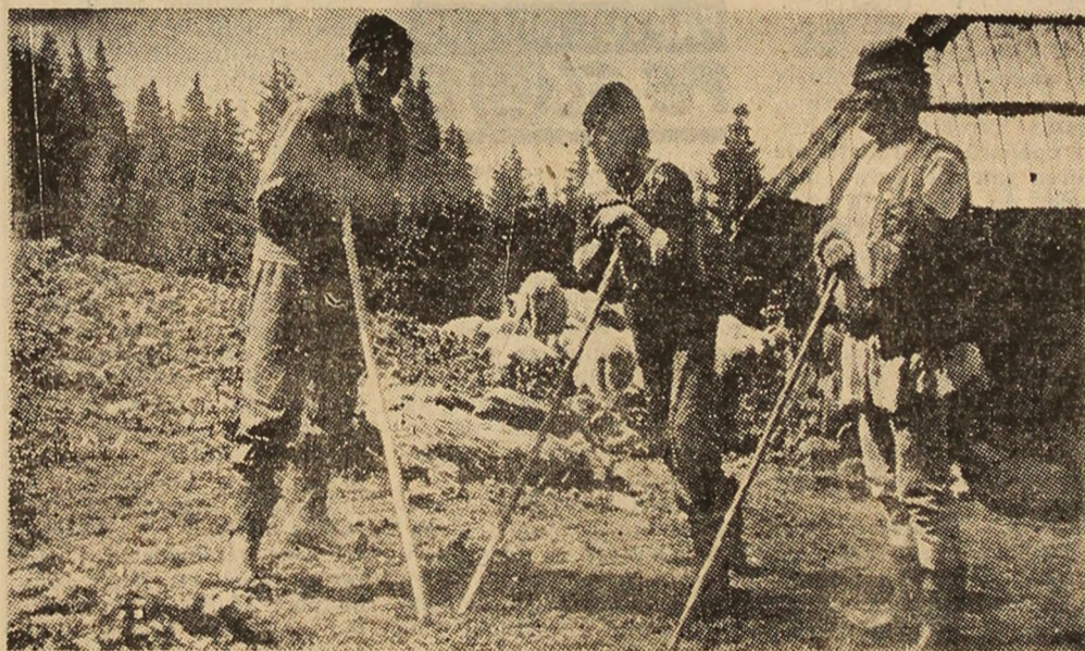
Imagine cu trei generații de ciobani de la stîna din Muncelul Jiului, bunic, tată și nepot la ciobănit.