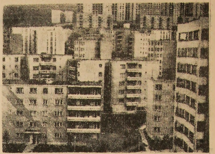
Vulcan: Tinerețe și modernitate.

ORGANUL COMITETULUI MUNICIPAL PETROȘANI AL P.C.R. ȘI AL CONSILIULUI POPULAR MUNICIPAL