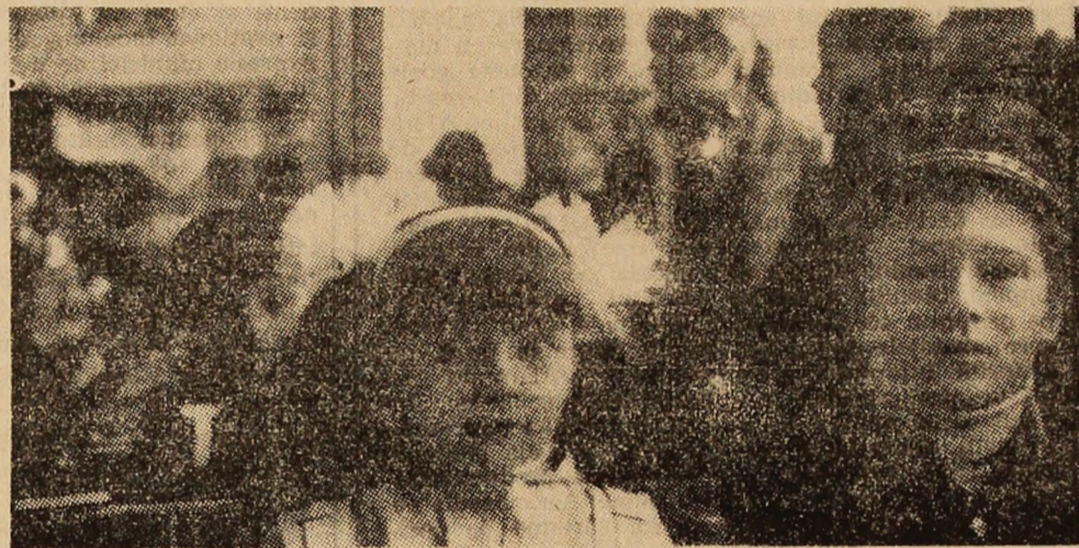
Prima oră, primul contact cu școala.

ziță. În anul școlar trecut, 40 elevi ai școlii au fost premiați la fazele județene ale concursurilor pe obiecte, patru au participat la fazele republicane, unul a obținut un premiu special la Limba română. Așadar, condiții din cele mai bune pentru studiu și educație în noul an școlar. Succes!