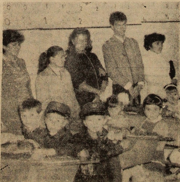
Părinți și „boboci” la ora primelor emoții.