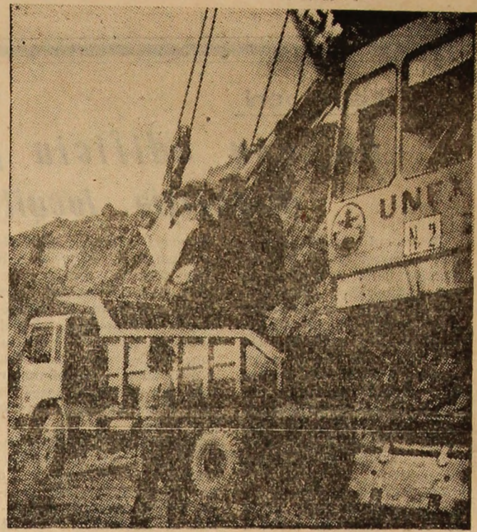
Aspect de muncă de la Căriera Cimpu lui Neag.