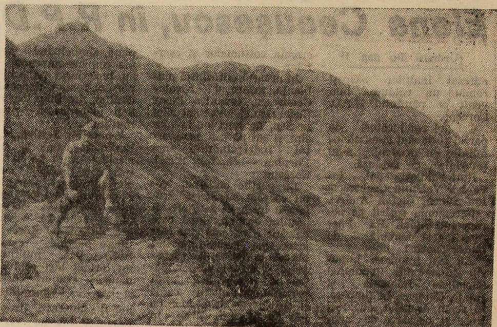
Munții Retezat. Tăurile Custurii.