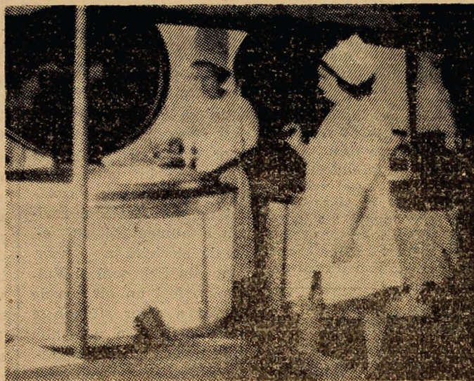
Cantina L.A.C.C.V.J. de la Petrița, o unitate modernă de care beneficiază minerii.

O problemă veche, „pasată” mereu de la Consiliul popular Aninoasa la C.F.R. și invers este cea a pasajului de peste calea ferată, la intrarea în comună. Pasajul reprezintă un real pericol pentru deteriorarea autovehiculelor. Soluția cu dalele, care a fost realizată, nu este cea mai fericită. De aceea este necesar un efort (mic!) conjugat, din partea conducerii gării Iscroni, districtului de drumuri și poduri, a întreprinderilor de pe raza comunei Aninoasa și a consiliului popular comunal, pentru a rezolva și acest neajuns. (B. Mircescu)